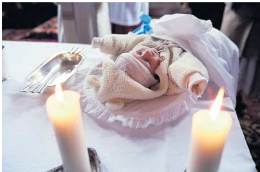
Ist sein Erfolg im zarten Säuglingsalter bereits programmiert?